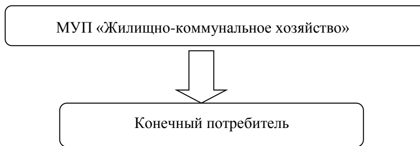
Рис.1.1 Функциональная схема централизованного теплоснабжения с.Тигрицкое